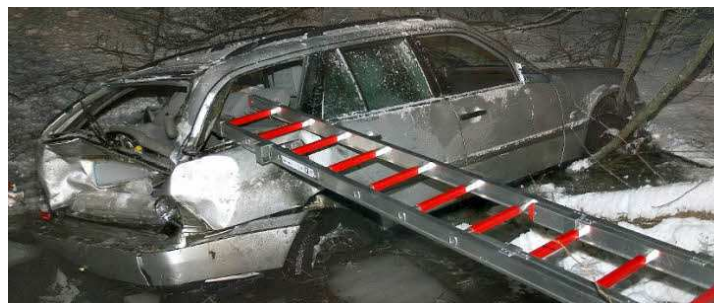
Mit letzter Kraft konnte sich der Fahrer des Mercedes befreien und Hilfe verständigen. Jetzt liegt der Mann mit lebensgefährlichen Verletzungen im Krankenhaus.

mit lebensbedrohlichen Verletzungen im Coburger Klinikum. An seinem Fahrzeug entstand Totalschaden in Höhe von etwa 10 000 Euro. Der Mercedes konnte erst nach dem Beseitigen von Büschen aus dem Dorfteich gehoben werden. Der Sachschaden an der Bepflanzung und an den umgefahrenen Verkehrszeichen beträgt zusätzlich etwa 1000 Euro.