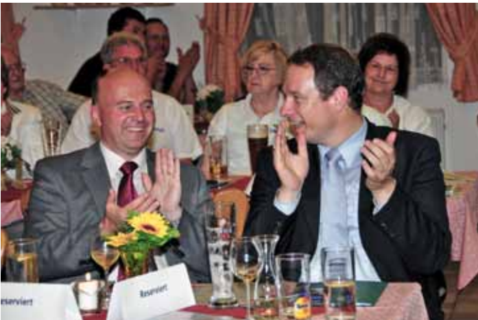
...mit dem Bayerischen Finanzminister Georg Fahrenschon

Das Engagement hat sich gelohnt. Mit über 50% der Erststimmen konnte ich ein achtbares Ergebnis erzielen und damit mit kräftigem Rückenwind wieder die Arbeit als direkt gewählter Bundestagsabgeordneter in Berlin aufnehmen. Für die Hilfe und Unterstützung im Wahlkampf danke ich sehr. Auf dieser Seite finden Sie eine kleine Auswahl von Wahlkampfimpressionen. Nochmals vielen Dank! Ihr Hartmut Koschyk.