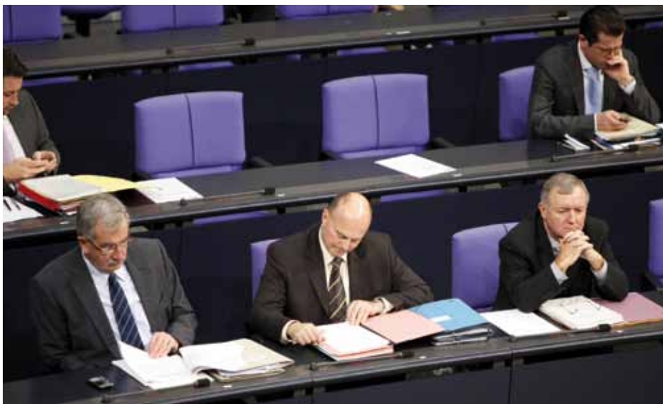
Neuer Platz von Hartmut Koschyk auf der Regierungsbank im Deutschen Bundestag