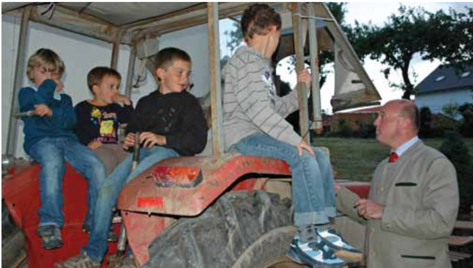
Bleibt Herzensangelegenheit von Hartmut Koschyk: Unterstützung der bäuerlichen Familien.