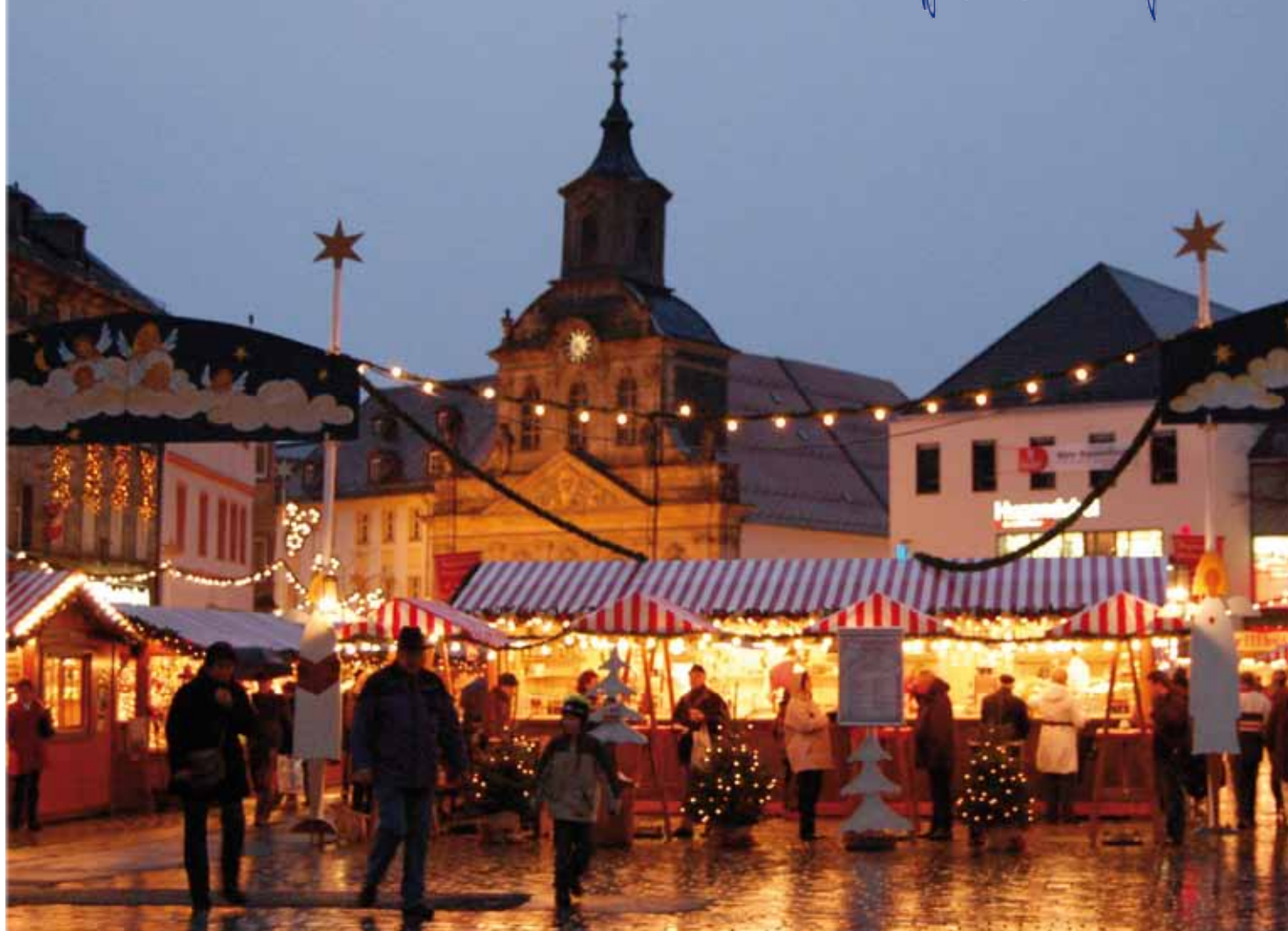
Blick auf den Bayreuther Weihnachtsmarkt mit der Spitalkirche