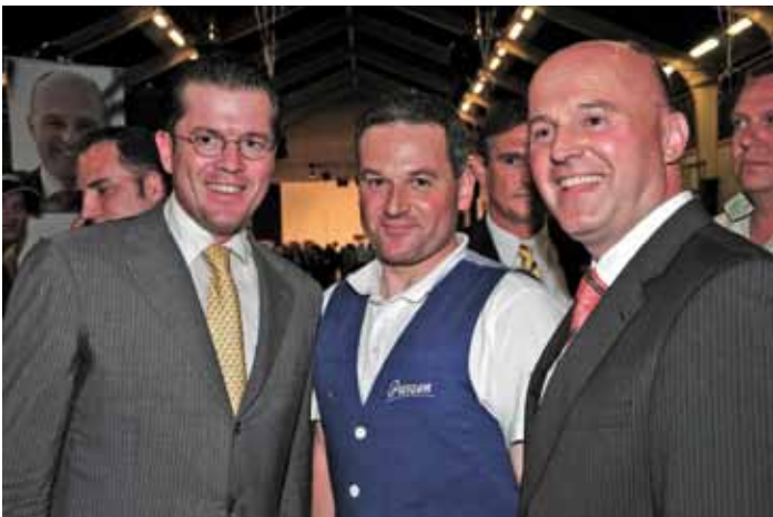
...mit dem damaligen Wirtschaftsminister zu Guttenberg