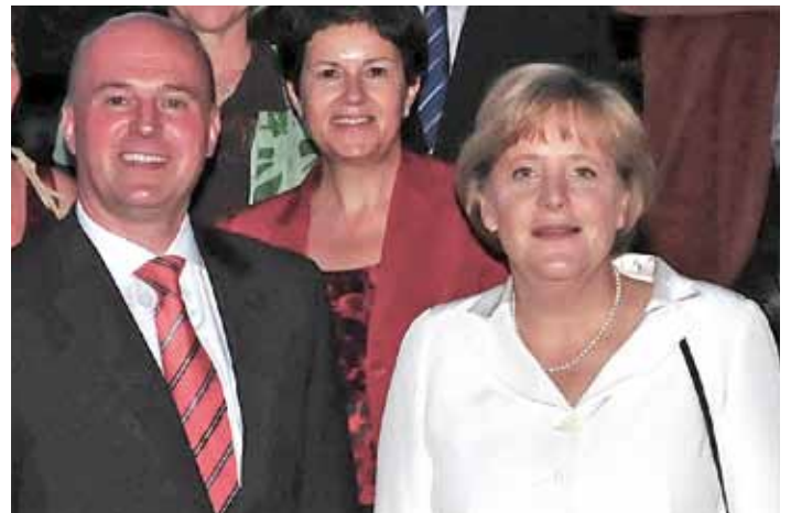
...mit Bundeskanzlerin Dr. Angela Merkel