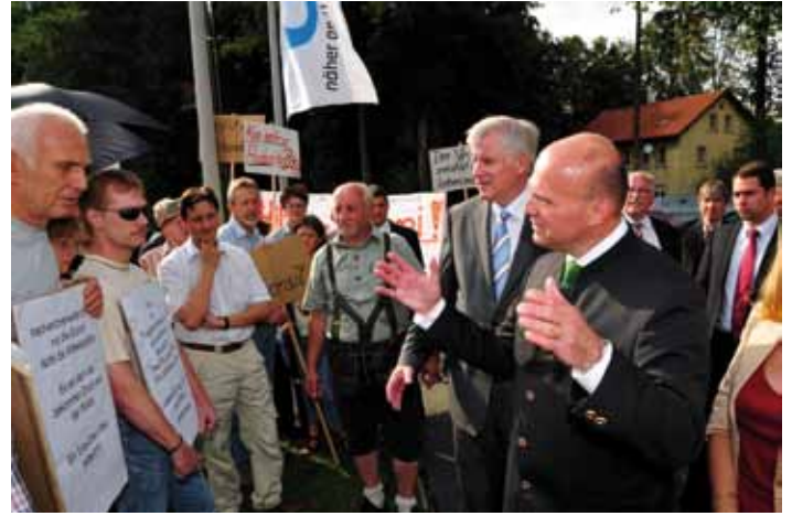
...mit Ministerpräsident und dem CSU-Parteivorsitzenden Horst Seehofer