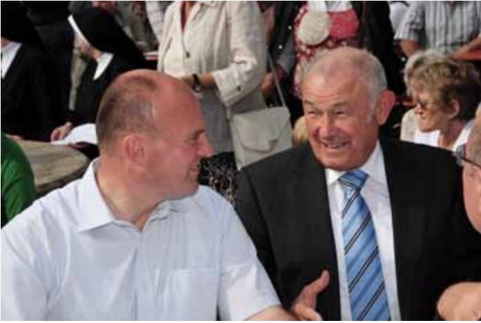
Hartmut Koschyk mit Ministerpräsident a. D. Dr. Günther Beckstein