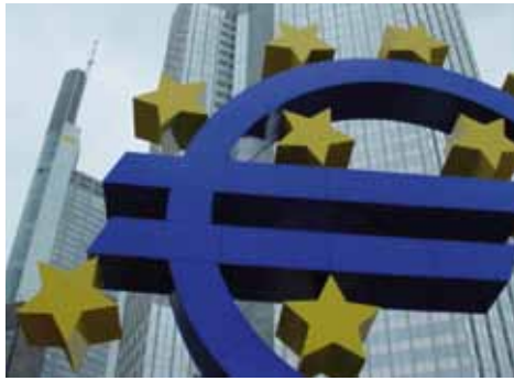
Bewährungsprobe Euro: Inwieweit sich die Krise in Griechenland auf andere Mitgliedsstaaten ausweitet, bleibt vorerst noch abzuwarten.

Alle Spekulationen über mögliche Hilfsmaßnahmen für Griechenland schaden den Konsolidierungsbemühungen, da sie das Vertrauen in die Handlungsfähigkeit und den politischen Willen der griechischen Regierung unterminieren. Es ist sinnvoll, dass Experten des Internationalen Währungsfonds (IWF) technische Hilfe bei der Bewertung und Überwachung des griechischen Sparpakets leisten. Eine weitergehende Rolle des IWF – etwa in Form direkter Finanzhilfen – würde jedoch zum jetzigen Zeitpunkt das Vertrauen der Finanzmärkte in die Eurozone beschädigen.