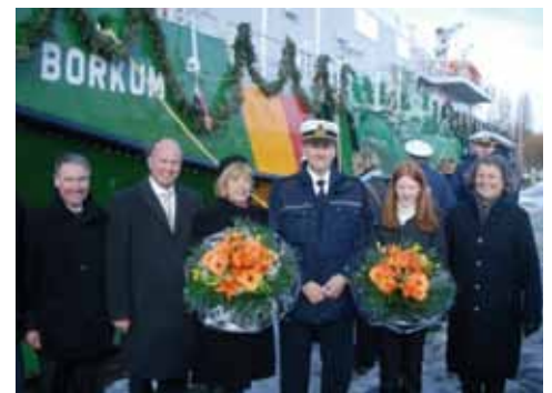
Allzeit Gute Fahrt: Die hochmoderne „Borkum“ hat durch ihre Doppelrumpfbauweise hervorragende Seeigenschaften und verstärkt ab sofort die Flotte des Zolls.

Seeigenschaften und bieten auch bei widrigen Seegangsverhältnissen sicherste Einsatzbedingungen für die Besatzungen. Die Bauweise dieser 50-m-Schiffe minimiert die Angriffsflächen für Wellen und sorgt damit für eine vom Seegangsgeschehen weitgehend „entkoppelte“ stabile Plattform. Der diesel-elektrische Antrieb sorgt für einen ökonomischen Betrieb, indem er die laufenden Dieselaggregate besonders wenig beansprucht. Hartmut Koschyk ist der für den Zoll zuständige Staatssekretär im Bundesfinanzministerium.