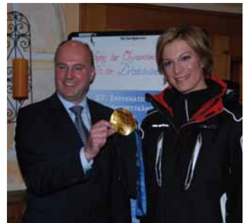
pischen Winterspiele in Vancouver.

vordere Reihe: Kathrin Hölzl, Maria Riesch, Katharina Dürr