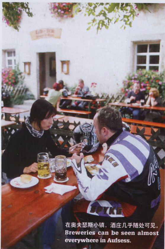
在奥夫瑟斯小镇，酒庄几乎随处可见。 Breweries can be seen almost everywhere in Aufsess.

的树种，它的藤蔓攀到各种高高的树干上，蔓延在各种连接线上，形成漫长的绿色林荫。在收获季节，谷仓中飘着啤酒花苦味素微苦的绿色清香，薄如蝉翼的啤酒花被从芽苞中剥出来，然后在干燥炉中烘干。农夫们细心地看护着自己的啤酒花种植园。