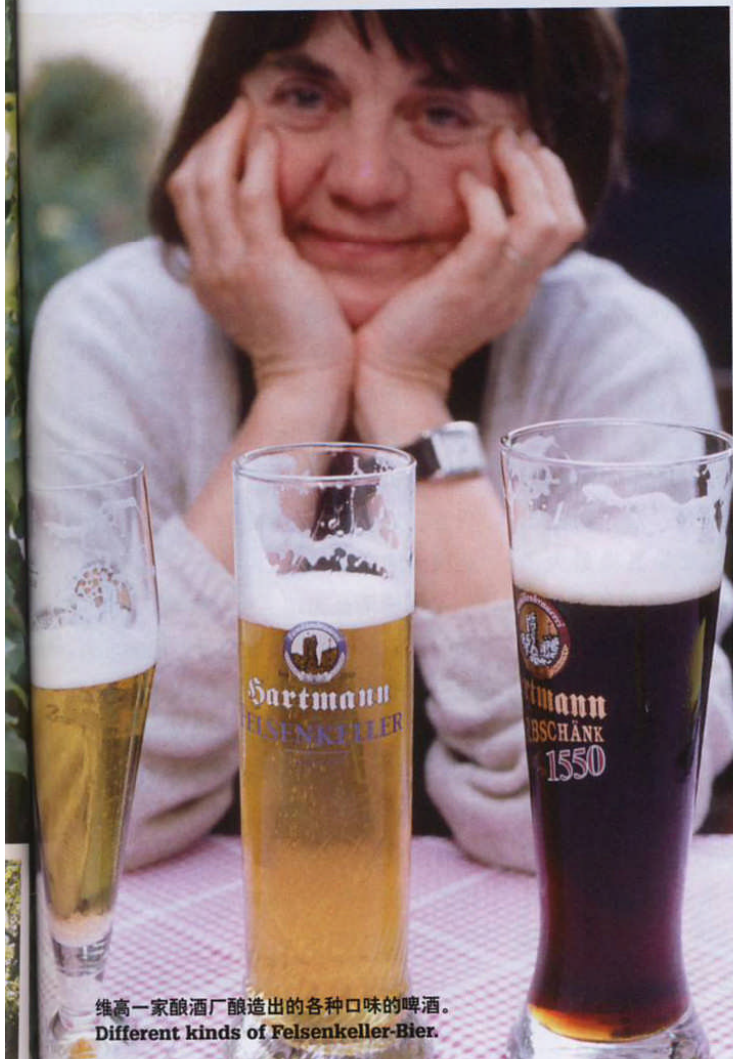
维高一家酿酒厂酿造出的各种口味的啤酒。 Different kinds of Felsenkeller-Bier.

是举办圣餐一样：水就是圣体，麦芽就是圣灵，啤酒花就是圣血，而发酵粉则是酿造啤酒的精髓。每当开始有朝圣者们路过，酒馆的老板们就开门接客。冬天尚未过去时，首批朝圣者就已经光临克罗伊茨贝格（Kreuzberg）。饥渴的旅行者们蜂拥至高大的栗子树下的露天食肆，除了啤酒之外，他们的菜谱还包括胡萝卜和洋葱炒烤香肠、熏香肠或是肉汁蒸香肠，泡菜配烤猪肉，加上生葱配面团布丁或是松软奶酪以及粗面面包。这里根本就不需要服务生，人们都自己直接到啤酒酒窖的门口去端饮料。多半情形下，啤酒都来不及过滤，所以有些浑浊。根据德国法律，每种麦芽啤酒只能含有啤酒花、麦芽和发酵粉，但非常奇怪的是，在每一家食肆、酒馆或酒窖，啤酒的风味各不相同。