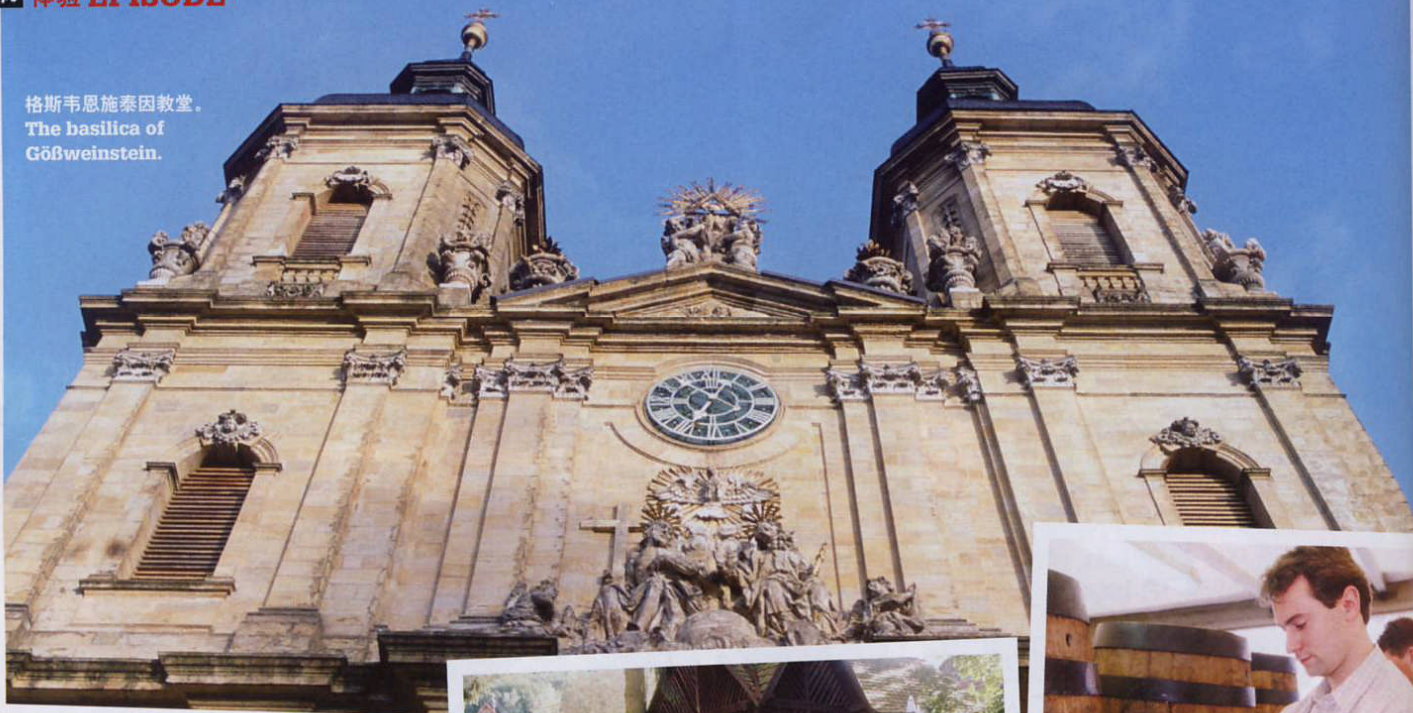
格斯韦恩施泰因教堂。 The basilica of Gößweinstein.