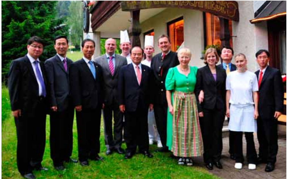
Auf ihrer Tour durch den Landkreis Bayreuth machte die südkoreanische Delegation aus dem Landkreis Goseong zusammen mit dem Bayreuther Bundestagsabgeordneten Hartmut Koschyk (4. von links) auch Station im historischen Bischofsgrüner Gasthof Hammerschmiede bei der Gastwirtsfamilie Rieß

Noch im laufenden Jahr will eine oberfränkische Delegation unter der Leitung von MdB Koschyk zum Gegenbesuch nach Goseong aufbrechen, um die neue Zusammenarbeit weiter zu vertiefen.