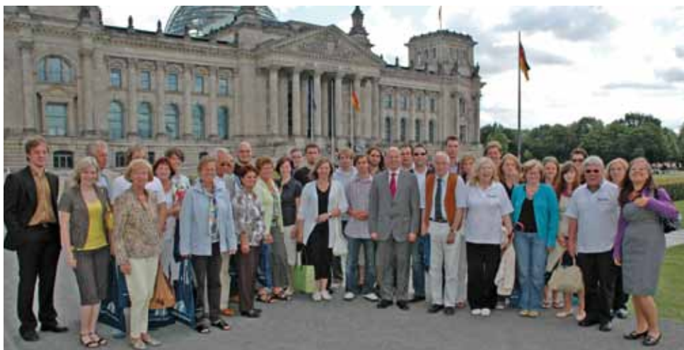
„Wir für Koschyk“ in Berlin. Vor dem Reichstag traf man sich zu einem gemeinsamen Gruppenbild mit Hartmut Koschyk. Die Gruppe war auf Einladung von Hartmut Koschyk für drei Tage in der Bundeshauptstadt.