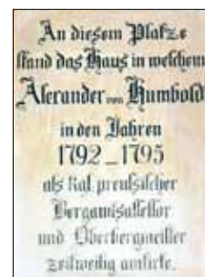
Am heutigen Gasthof Alexander von Humboldt in Goldkronach erinnert diese Tafel an den Aufenthalt des Wissenschaftlers.