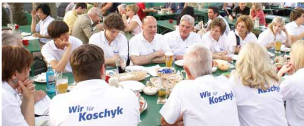
Im Storchenkeller in Bayreuth fand das erste Treffen der unabhängigen Wählerinitiative mit Hartmut Koschyk statt. Er war beeindruckt von der großen Resonanz und einem „gelungenen Generationenmix“.

Auf Einladung von Hartmut Koschyk besuchten viele Team-Mitglieder die Bundeshauptstadt Berlin. Das aus Jung und Alt zusammengesetzte Team zeigte sich über die einzelnen Informationsveranstaltungen begeistert. Eine in jeder Hinsicht gelungene Fahrt, die auch als Einstimmung des Teams „Wir für Koschyk“ auf das kommende Wahlkampfgeschehen gesehen werden kann. Der Zusammenhalt, der sich hier über die Generationen hinweg entwickelte, setzt wichtige Impulse für unser Unterstützerprojekt.