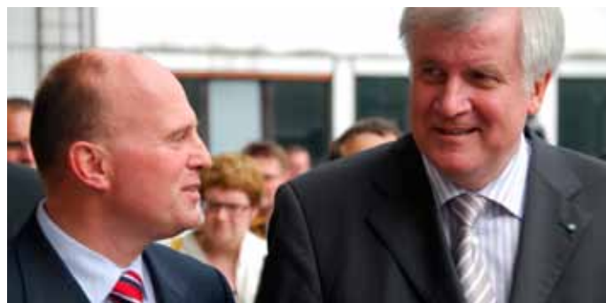
Koschyk: „Es ist Bayerns Ministerpräsidenten Horst Seehofer zu danken, dass die Rosenthal-Rettung zur Chefsache gemacht worden ist!“

Mit der Übernahme des in die Insolvenz geratenen Porzellanherstellers Rosenthal mit seinen mehr als 1.000 Mitarbeitern in Deutschland und den zwei Fabriken in Speichersdorf und Selb schreibt der traditionsreiche italienische Besteckhersteller Sambonet nun ein neues Kapitel der Rosenthal-Geschichte. Am 10. Juli wurde mit Zustimmung des Hauptgläubigers, der Bank of America, die neue „Rosenthal GmbH“ als Auffanggesellschaft und Inhaber der Markenrechte gegründet. Vor der Übernahme waren 300 Mitarbeiter entlassen und unrentable Standorte geschlossen worden. Die jetzt gefundene Zukunftslösung für die Rosenthal AG bietet alle Chancen die Marke Rosenthal, aber auch die Arbeitsplätze in den oberfränkischen Standorten zu erhalten. Hartmut Koschyk hat sich in den vergangenen Monaten intensiv für eine Zukunftslösung stark gemacht.