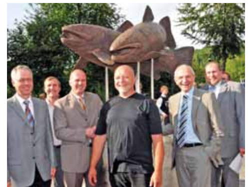
Diese Forellenskulptur aus Bronze ist jetzt in Behringersmühle in der Fränkischen Schweiz zu sehen.