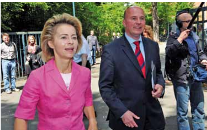
Auf dem Weg zur Kinderoper: Bundesfamilienministerin Ursula von der Leyen, begleitet von Hartmut Koschyk.