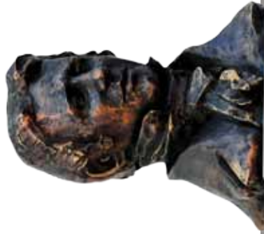
ALEXANDER VON HUMBOLDT