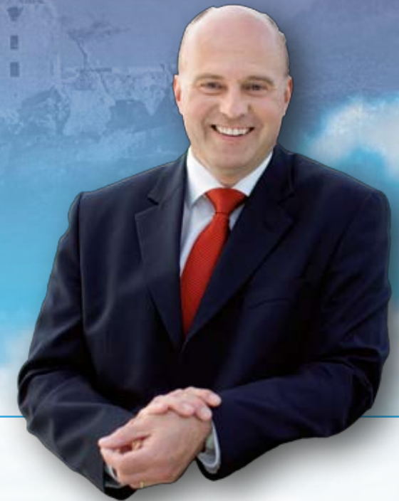
Hartmut Koschyk MdB Parlamentarischer Staatssekretär beim Bundesminister der Finanzen