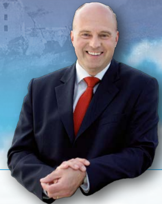
Hartmut Koschyk MdB Parlamentarischer Staatssekretär beim Bundesminister der Finanzen

Tel.: 0921 / 76 43 01 5 Fax: 0921 / 560 64 24 Mail: hartmut.koschyk@wk.bundestag.de