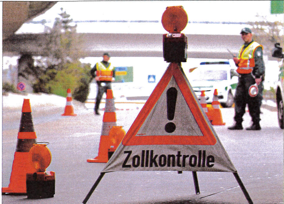
Kofferträger aufgepasst Geldschmuggler müssen mit verstärkter Fahndung rechnen

In diesem Frühjahr drehte die Staatengemeinschaft die Daumenschrauben noch enger. Steuerhinterziehung gilt nun ab 50 000 Euro als Vortatbestand zur Geldwäsche und wird damit ähnlich wie Schmuggel, Drogen- und Menschenhandel bestraft. Vor allem die Amerikaner verstehen