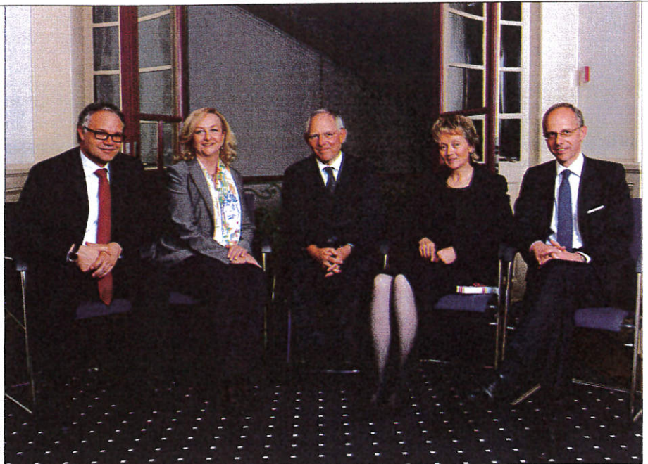
Eine schrecklich nette Familie Die Finanzminister der fünf deutschsprachigen Länder

Das wiederum hängt mit einem Problem zusammen, vor dem fast alle Steuerflüchtlinge gemeinsam stehen: Ihre Kommunikationsmöglichkeiten sind beschränkt. Telefonate können abgehört und E-Mails abgefangen werden. Vor allem die USA greifen in ihrem Kampf gegen Drogen- und Terrorfelder, inzwischen aber auch gegen Steuerhinterziehung, zu allen verfügbaren Mitteln.