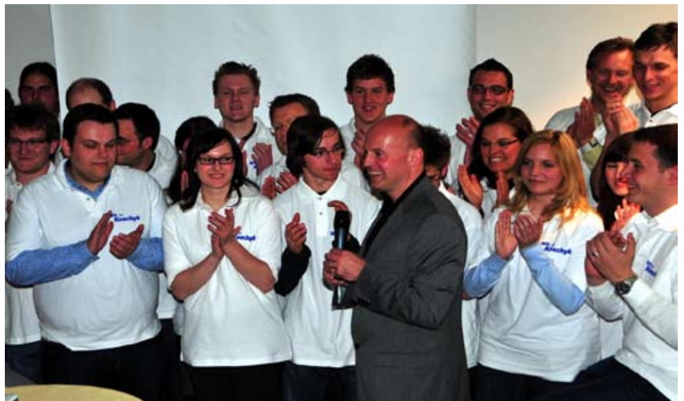
Hartmut Koschyk gemeinsam mit Mitgliedern des Teams „Wir für Koschyk“ bei der Präsentation der neuen Homepage.

Hartmut Koschyk gab im Rahmen der Präsentation auch den Startschuss für das Team „Wir für Koschyk“. Hier finden sich Menschen aller Altersgruppen mit dem Ziel zusammen, Hartmut Koschyk im Bundestagswahlkampf zu unterstützen. Interessierte können sich melden in der CSU-Bundeswahlkreisgeschäftsstelle unter der Telefonnummer: 0921-764300 oder bayreuth@csu-bayern.de